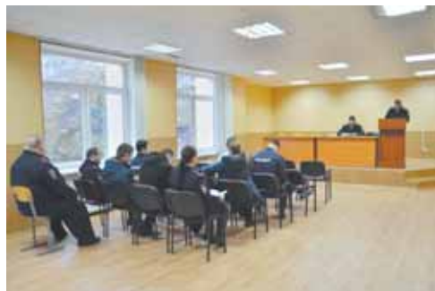
Служебное совещание в 3-м отделе полиции

он уже давно находится на рабочем месте. С его слов я поняла, что ровно в девять утра – ни минутой позже – проходит служебное совещание у руководства, на ко-