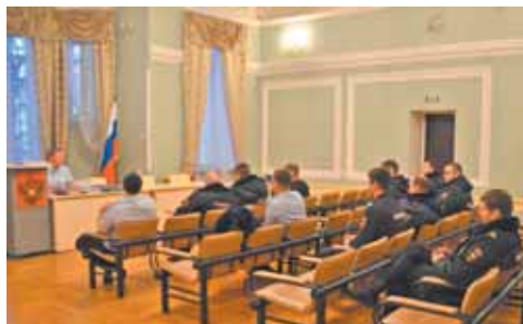
Служебное совещание в 21-м отделе полиции

Пока шло служебное совещание, я бродила по коридорам отделения. В приоткрытую дверь увидела девушку в форме, сидящую за компьютером. Не удержалась, зашла познакомиться. Выяснилось, что очаровательного капитана полиции зовут