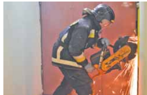
Спасатель МЧС вскрывает дверь на пр. Мечникова, д. 5/2